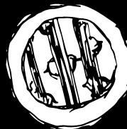
BIACIDIC BOND COMPLEX